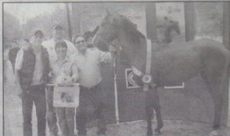
El caballo oaxaqueño WMA Zebulun ganó el primer lugar y el premio de "Mejor Condición" en la categoría de 60 kilómetros.

Asimismo un total de seis equinos emprendieron el viaje desde Teotitlán del Valle y completaron en la categoría de 40, 60 y 80 kilómetros, logrando el 100% de terminaciones